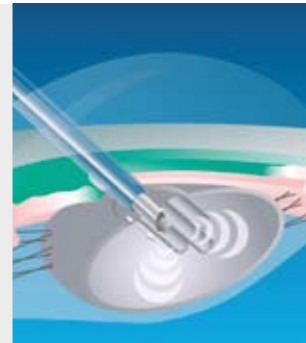
Zerkleinern der Linse durch Ultraschall