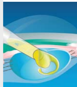
Einsetzen der Kunstlinse